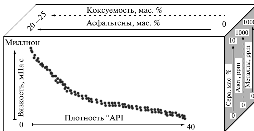
Рис. 1. Тенденция в изменении средних значений содержания некоторых компонентов и свойств нефти с ростом плотности [3].

продуктов доля высоковязких тяжелых нефтей, вовлекаемых в переработку, будет неизбежно возрастать [2]. С увеличением плотности нефти в ней увеличивается содержание смолисто-асфальтовых веществ, гетероатомов и металлов [3] (рис. 1). Присутствие в значительных количествах именно этих компонентов приводит к снижению атомно-